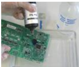
1) Aufbringen des Indikators