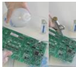
2) Abspülen / Trocknen