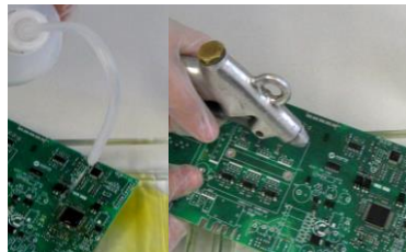
2) Abspülen / Trocknen