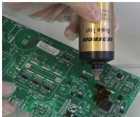
1) Aufbringen des Indikators