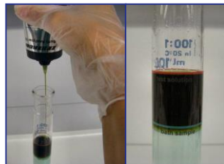
2) Ajout du réactif