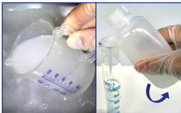
1) Prise d'échantillon/transfert