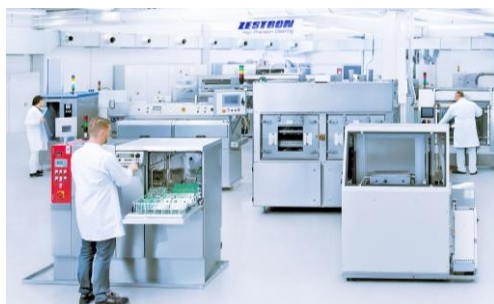
装置テストセンター